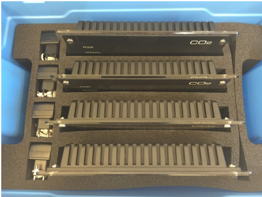
Korrekte Verstaung der Messgeräte

2. Verschiessen Sie die Box und vergewissern Sie sich, dass der Deckel richtig hält.